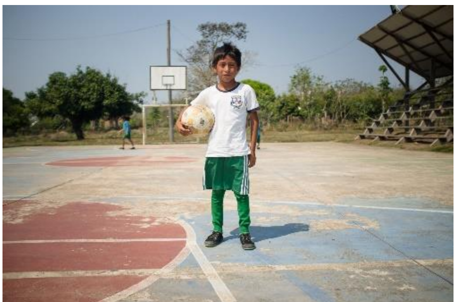
Niño.

Pour gagner sa vie, il recherche sans cesse des contrats publicitaires et autres mais il passe surtout son temps sur Internet, à postuler à des concours pour entrer dans des festivals, publier ses photos et toucher un maximum de personnes afin d'agrandir son réseau :