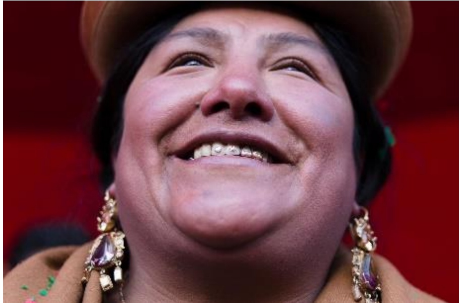
Dents en or.