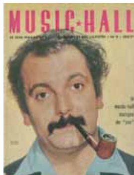
Music-hall, octobre 1955