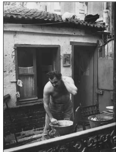
Brassens se lavant, impasse Florimont, 28 octobre 1953.