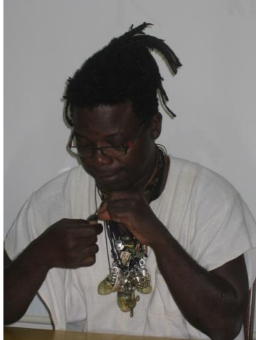
Romuald Hazoumé et ses porte-bonheur (23/01/2012)

Comment un petit africain avec une enfance difficile est devenu un artiste célèbre dans le monde. Romuald Hazoumé expose ses œuvres (peintures, sculptures, photos...) sur tous les continents.