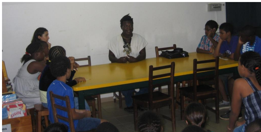
Rencontre avec Romuald Hazoumè à la bcd