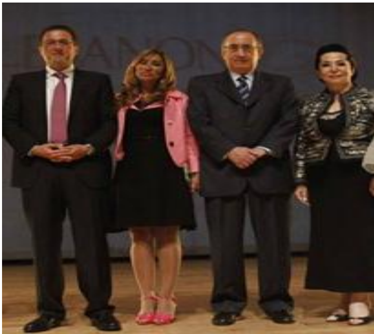
Remise du prix de la Femme exceptionnelle pour l'innovation 2012.

Ces prix reflètent sa passion et son assiduité pour la recherche.