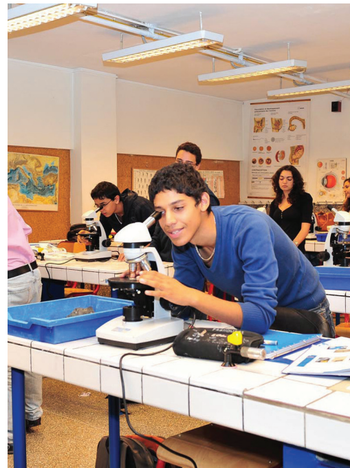
Liceo francés René-Descartes de Rabat - Marruecos