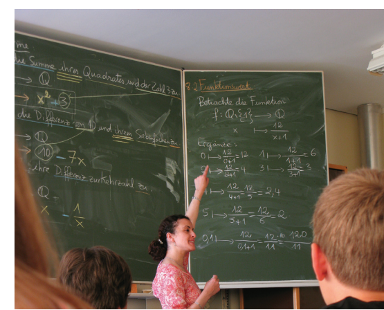
Liceo franco alemán de Sarrebruck - Alemania