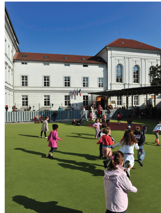
Liceo francés de Praga - República Checa

La Agencia para la Enseñanza Francesa en el Extranjero (AEFE) es una entidad pública que depende del Ministerio de Asuntos Exteriores. Creada en 1990, se encarga del seguimiento y coordinación de la red de centros de enseñanza francesa en el extranjero. Además del papel que desempeña como garante del modelo educativo francés en el extranjero, la AEFE es también un actor esencial de la política de influencia cultural y lingüística de Francia. Por último, constituye una baza para la capacidad de atracción de la enseñanza superior francesa.