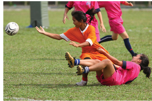
Liceo francés René-Descartes de Phnom Penh – Camboya