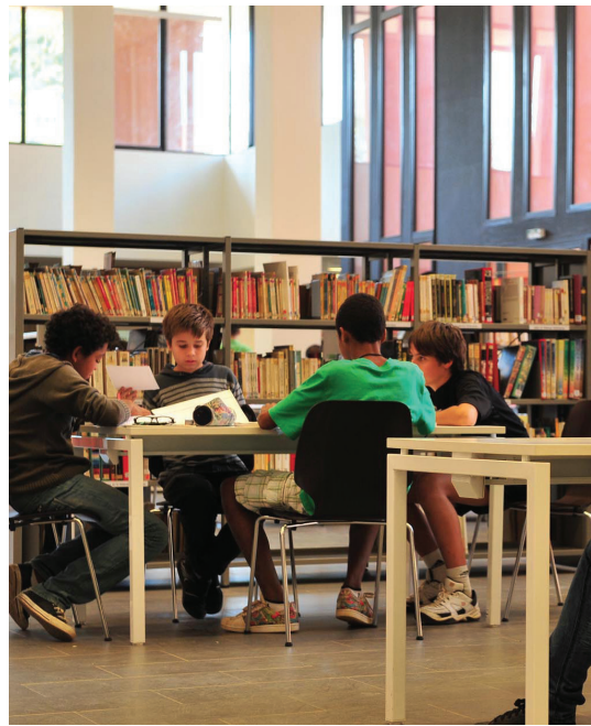
Liceo francés Jean-Mermoz de Dákar - Senegal

En el marco de su cometido de cooperación educativa, la AEFE es la entidad pública encargada de gestionar dos programas complementarios llevados a cabo fuera de la red homologada: