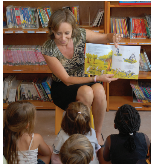
Liceo francés Julio-Verne de Johannesburgo – Sudáfrica

Se conceden becas a familias en función de sus recursos económicos para ayudarles a pagar la escolaridad de sus hijos. Este dispositivo de becas está destinado a los alumnos franceses a partir de 3 años de edad, inscritos en el registro mundial de franceses que viven en el extranjero y escolarizados en un centro de enseñanza francés.